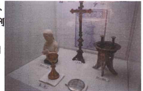
ジュリアに関する展示

かつて徳川家康の寵愛を受けるも、キリスト教信仰を捨てなかったために神津島に流刑され、その後も信仰を守り島民の生活を献身的に助けたとされる「おたあ・ジュリア」に関する資料や、島で毎年5月に行われる「ジュリア祭」を記録した資料などが展示されています。