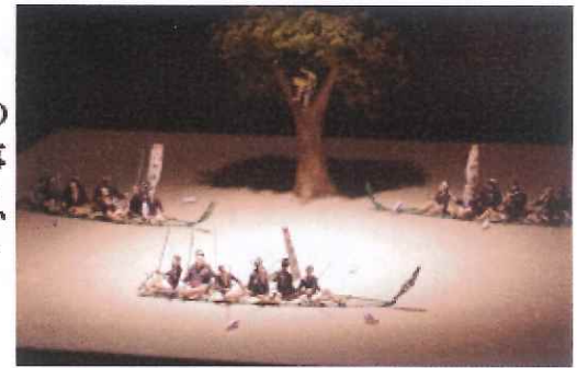
神事の様子を表した模型

神津島で行われる祭事の一つで、国の重要無形文化財であるカツオ釣り神事についての専用展示設備があり、音声、模型、映像を用いた詳しい解説を受けることができるようになっています。