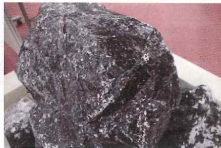
巨大な黒曜石標本

神津島の各地で産出する「黒曜石」と呼ばれる火山ガラスの巨大な標本が展示されています。また、神津島産黒曜石についての展示も併設されており、石としての性質や詳しい産出地点、そしてこの石が持つ歴史的価値についての詳しい解説をみるすることができます。