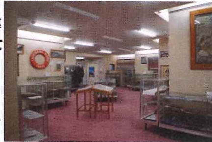
館内の展示の様子

その後何度かの増築、改修が行われ、現在は本来の目的に加え、展示資料を通じて島内外の人々が出会い交流する場となっています。