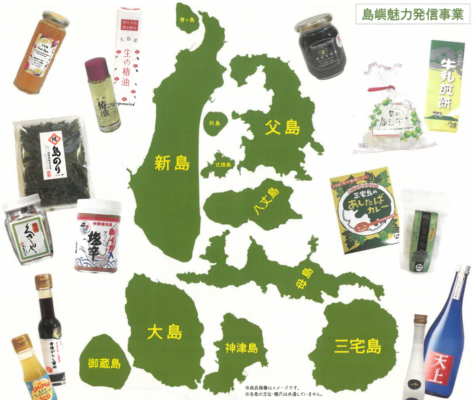
※商品画像はイメージです。 ※各島の方位・縮尺は共通していません。