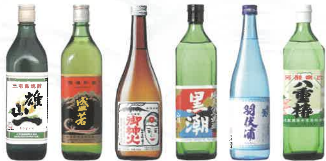
※商品画像はイメージです。

ぽっぽ町田 10:00 ▶ 19:00 12/6 金 ▶ 22 日 ※営業時間は変更になる場合があります。